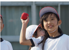
テレコンあり 600mm相当 (35mm判換算)