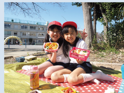
M.ZUIKO DIGITAL ED 14-42mm F3.5-5.6 EZ