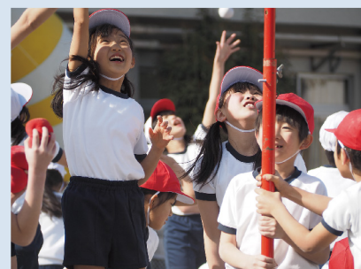
M.ZUIKO DIGITAL ED 40-150mm F4.0-5.6 R