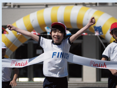
M.ZUIKO DIGITAL ED 40-150mm F4.0-5.6 R