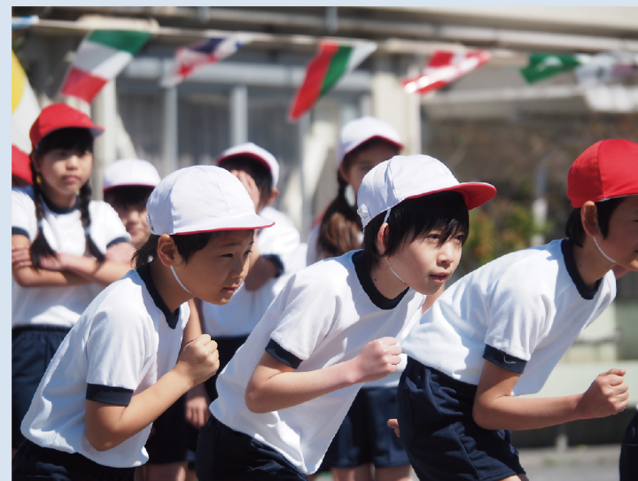
M.ZUIKO DIGITAL ED 14-150mm F4.0-5.6 II