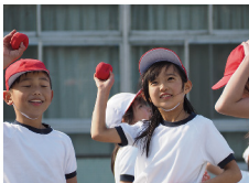
テレコンなし 300mm (35mm判換算)